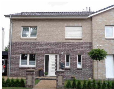
Liegende Fensterformate m. Teilung