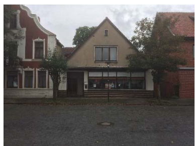
Wechsel 1- + 2-geschossige Gebäude