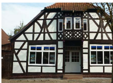
Fachwerkfassade, hell verputzt

Insgesamt sind in Bereich 1 (Altstadt) mehr Fachwerkfassaden vertreten als in Bereich 2. In Bereich 2 gibt es dafür mehr helle Putzfassaden. Die Farbpalette der verputzten Häuser ist hier einheitlicher als in Bereich 1 (in Bereich 2 überwiegt mit ca. 80 % Weiß als Farbe von Putzfassaden).