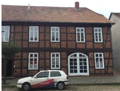
Stehende Fensterformate m. Teilung

Bei Fachwerkgebäuden handelt es sich meist um stehende Formate mit einer Sprossenteilung.