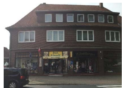
Walmdach mit Gaube

Um bei den Dächern einerseits genügend Flexibilität zu erhalten, andererseits aber eine harmonische Gestaltung zu erzielen, wird entsprechend des Bestandes eine Auswahl an Dachformen, -neigungen sowie Materialien und -farben vorgegeben.