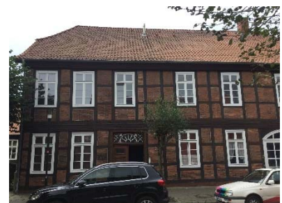
Fachwerkfassade, rot ausgemauert