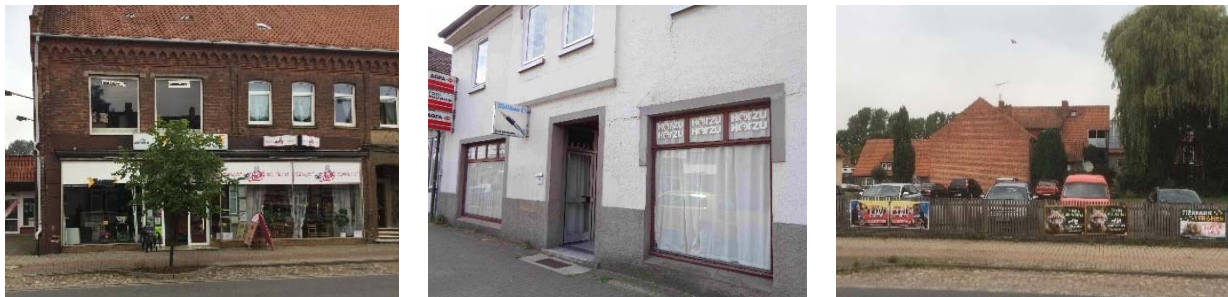
Beispiele zu bestehenden Werbeanlagen im Geltungsbereich

Die Werbeanlagen sind teilweise großformatig oder in Form von mehreren kleineren Anlagen pro Gebäude ausgebildet. Zudem handelt es sich besonders bei den Auslegerwerbeanlagen teilweise nicht nur um direkt geschäftsbezogene Werbungen, sondern um dem Geschäft zugeordnete Produktwerbung.