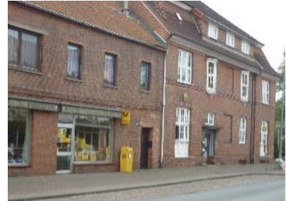
Beispiele zur Fassadengliederung im Geltungsbereich