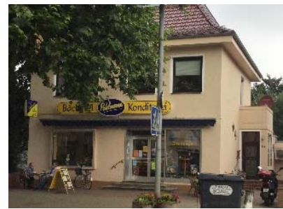
Schaufenster im Fassadengefüge

Damit sich die Fenster, Türen und Tore in alte Bausubstanz einfügen, sind für Gebäude, die vor 1935 entstanden oder in der Liste Stadtbild prägender Gebäude ( s. Anlage ) enthalten sind, nur Elemente aus Holz zulässig. Zudem wird hiermit zur ökologischen Nachhaltigkeit beigetragen.