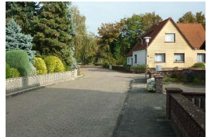
Mauer mit Metallelement

Die Vielfalt an möglichen Materialien und Formen soll weiterhin zulässig sein. Einfriedungen können jedoch das Erscheinungsbild erheblich beeinträchtigen, wenn sie abschottend wirken. Dies hätte gerade im Stadtzentrum erhebliche Folgen für den Gesamteindruck und das Ziel eines Einkaufs-, Erlebnis- und Kommunikationsbereiches. Damit die Straßenräume, Park- und Platzanlagen einen offenen Charakter mit Blickbezügen aufweisen, wird die Höhe von Einfriedungen an öffentlichen Flächen auf max. 1,20 m begrenzt.