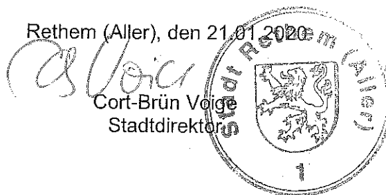
Cort-Brün Voigt Stadtdirektor